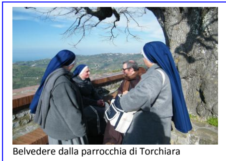
Belvedere dalla parrocchia di Torchiara

sembrato il momento più opportuno per quest’iniziativa.